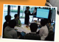
【コラボレーション commons イメージ図】