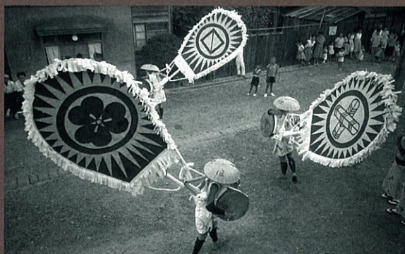
大海の放下 (愛知県新城市・1961年)