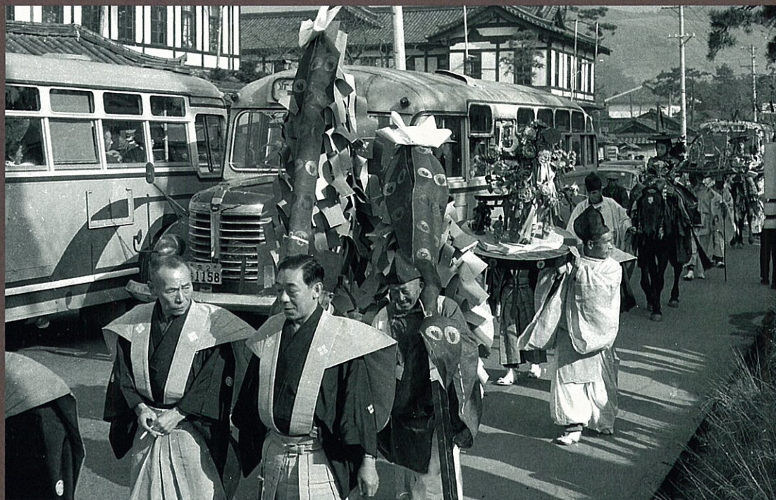
春日若宮おん祭 (奈良市・1962年)