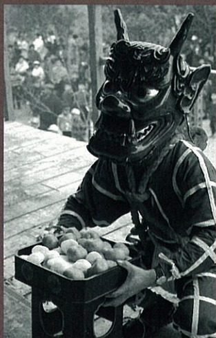
多聞寺の追儺式 (神戸市・1964年)