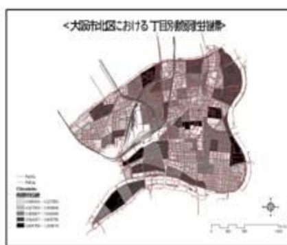
図2：居住階層を考慮した脆弱性指標

また、本研究は大阪市北区という都心部における居住と脆弱性についての検討を行うとともに、中越地震の被災地である川口町(現長岡市)をフィールドとして中山間部の過疎集落での居住地、居住場所と人との関係についての考察を試みている。大阪の都心部と新潟の中山間地域ではその居住形態もことなることから、地域における震災時の自助・共助・公助のあ