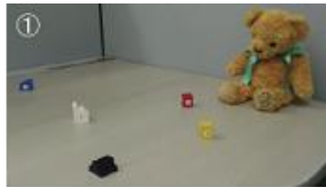
ぬいぐるみロボットを使った所有感実験の設定とその様子