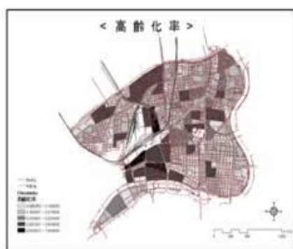
図1：丁目別高齢化率

その結果、単純に丁目別の高齢化率を2次元で捉えた場合には高齢化率の高い地域は大阪駅を中心とする地域から南に広がっているのに対し、脆弱性指標の高いエリアは区の東側に集中していることが明らかになった。高齢者の居住階層という「高さ」に注目すると避難行動や避難生活など震災後の地域社会に及ぼす影響は従来の捉え方とは異なることが示唆された。